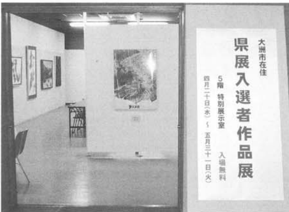
県展入選者作品展（5階特別展示室）

博物館では、年間通して資料を展示する「常設展示」やテーマや期間を定めて展示する「特設展示」のほかに、「特別展示」があります。主に五階の特別展示室で市民の皆様の作品などを紹介しています。特別展示室の利用を希望される方は、博物館にお問い合わせください。