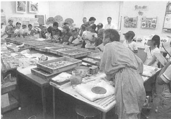
歴史文化教室「松山市考古館見学」