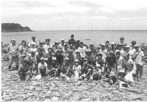
自然科学教室「夢永海岸の生物観察」