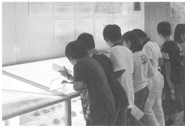
県外から小学生の来館（5階自然科学展示室）

この二番目の機能は、博物館の目的の中核です。市民の皆様はもとより県内外から来館される皆様に大洲地域の歴史や文化、自然の豊かさなどが伝えられるよう研修を深めてまいります。