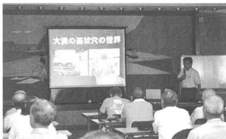
▲ 史談会例会 9月講話

大正六年(一九一七)の発足から満百年(中斷期間を含む)を迎えようとしていた本会は、歴代会員の皆様の地道な取り組みにより着実な成果を上げています。この地域の歴史や文化を掘り起こし光を当てた研究の多くは、会誌「温古」にまとめられています。興味をお持ちの方は、ご連絡ください。既刊の会誌も販売しております。