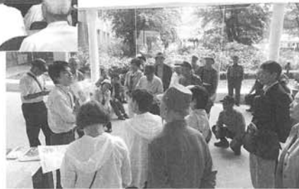
史談会研修旅行 (広島方面) ▶