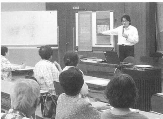
見聞講座「江戸期の名講師」