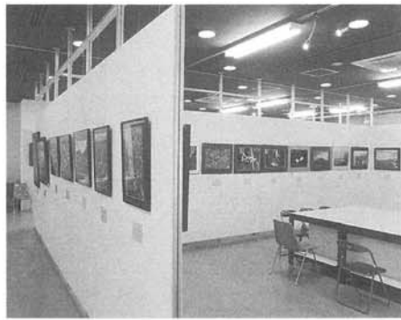
木を愛する会60周年記念写真展 (5階特別展示室)